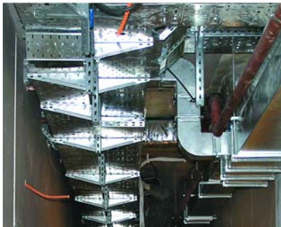
Рис. 2. Многоуровневая единая система кабельных трасс

зволяет учесть и отобразить все необходимые аксессуары: пятки, швеллеры, консоли, редукции, повороты, арки и др.