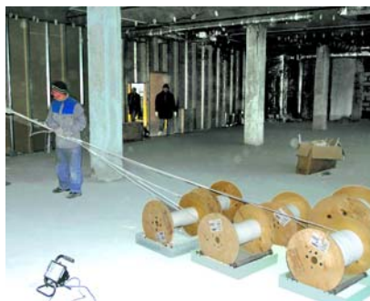
Рис. 4. Размотка кабеля с помощью поддона с валиками

Кабель PiMF600 производится компанией Tyco Electronics AMP , который только недавно появился на нашем рынке. Именно с таким типом кабеля напрямую связано обеспечение скорости передачи данных 10 Гбит/с. Индивидуальное экранирование каждой пары (PiMF – Pairs in Metal Foil) в комплексе с дополнительным общим экраном существенно снижают межкабельные наводки и обеспечивают превосходные характеристики ANEXT.