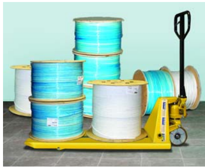
Рис. 3. Катушки с кабелем PiMF600

Объект VD MAIS оказался приятным исключением. Выступая генподрядчиком, фирма VD MAIS, сама работающая на рынке высоких технологий, прекрасно понимает значение кабельной инфраструктуры, и поэтому строительные работы в кроссовых комнатах были запланированы и выполнены на два месяца раньше, чем в остальных.