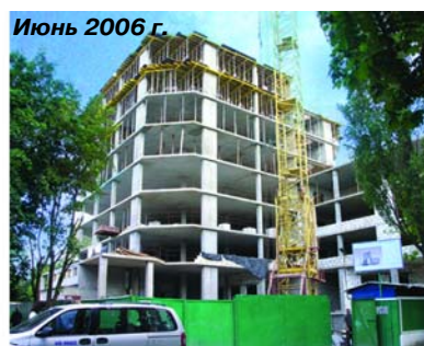
Июнь 2006 г.