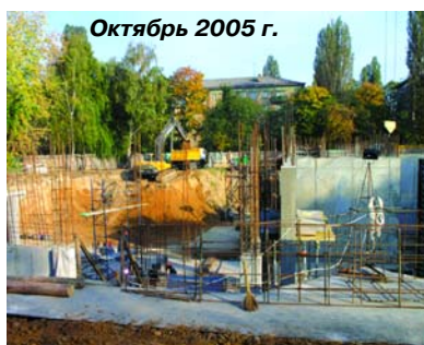
Октябрь 2005 г.

Фирма VD MAIS, выбирая решение для своей кабельной системы, руководствовалась принципами долгосрочности и перспективности и поэтому ориентировалась на современные тенденции в развитии этих технологий.