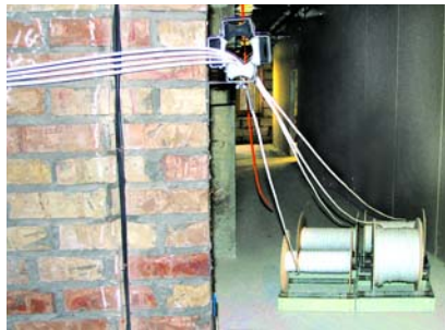
Рис. 5. Размотка кабеля и обход поворота

При прокладке кабеля особенно бережно следует обращаться с ним на поворотах. Обычно для этого на каждом повороте ставят для страховки по одному человеку. А на этом объекте мы увидели в деле специаль-