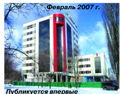
Февраль 2007 г.